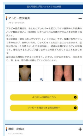
皮膚の病気を詳細に知る 医療機関を検索することも可能