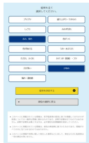
皮膚症状を選択(複数可)