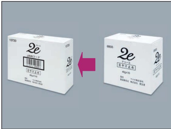
⑬内箱(日やけ止めの場合)