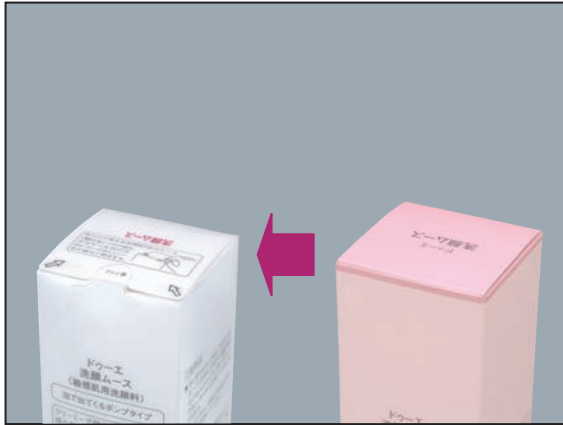
⑪封緘仕様(洗顔ムースの場合)