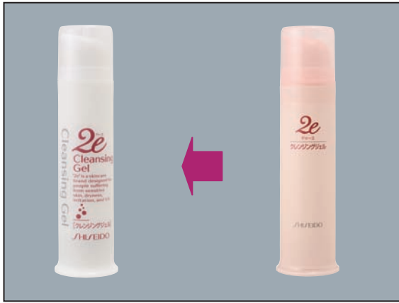
⑨クレンジングジェル