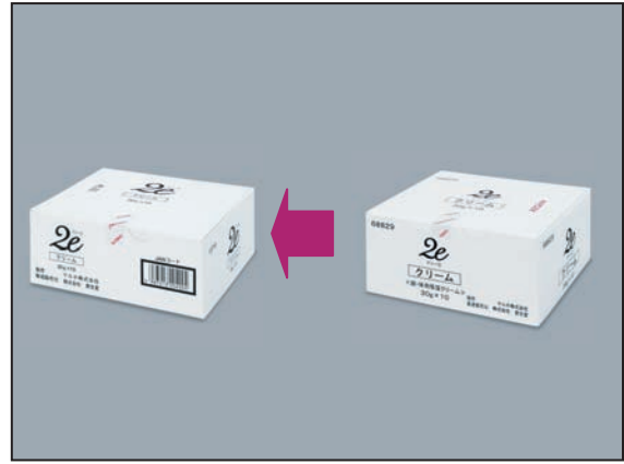
⑫内箱(クリームの場合)