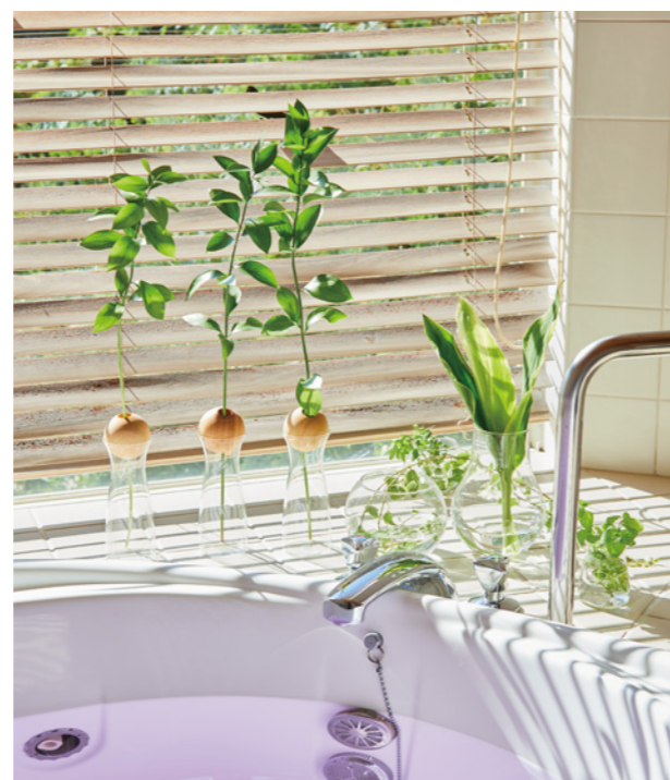
水栽培のグリーンをアクセントに