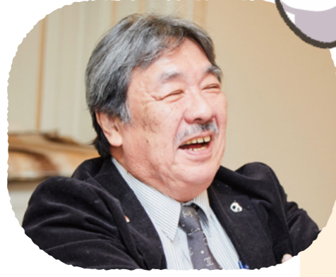
漫画監修: あたご皮膚科 副院長 江藤 隆史 先生