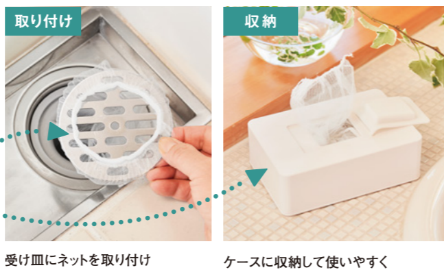
受け皿にネットを取り付け