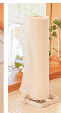
ロールスタンドに収納