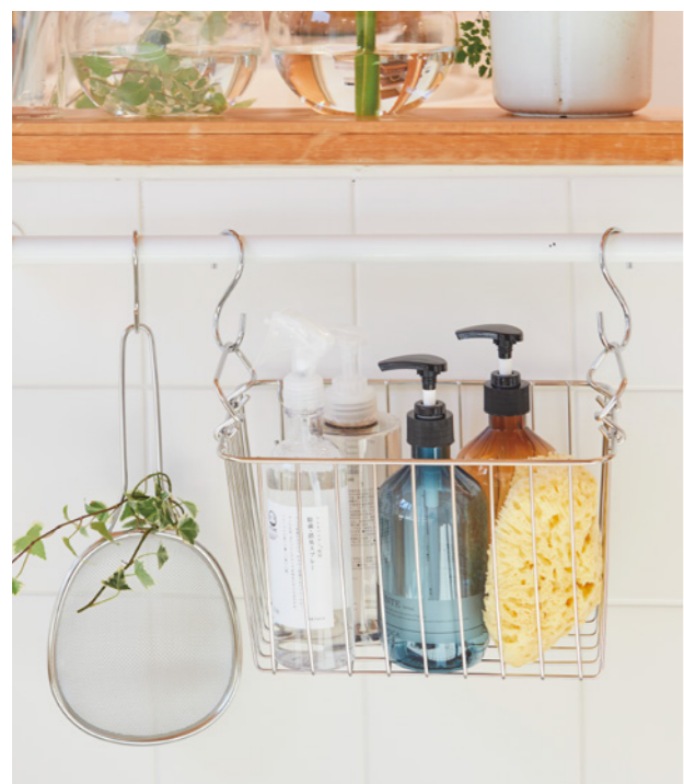
ワイヤーバスケットにまとめて収納