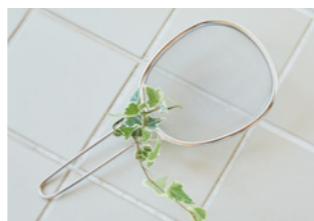
持ち手部分にあしらって

お風呂場に緑のアクセントを作ってみるのはいかがでしょうか。「お掃除が大変・・・」という気持ちも、緑のある空間が和らげてくれるかもしれません。浴室は高温、多湿で普通の植物は枯れやすいので、浴室栽培に向いた植物を選びましょう。また、土があると土にカビが生えることもあるので、水栽培できるものが、サッと水を取り替えられて浴室のインテリアとしても綺麗です。グリーン観葉植物は、浴室インテリアとして飾る以外にも、お掃除用具の持ち手部分にあしらってみるもの可愛いアクセントになりますよ。